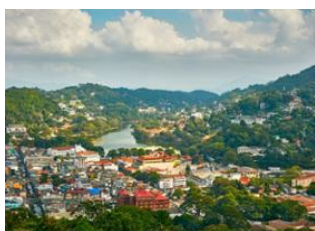
Aéroport international de Bandaranaïke 📍 🚗 120km Kandy 📍